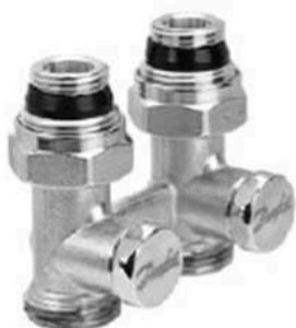
RLV-KS прямой с присоединением к отопительному прибору G ½ и G ¾