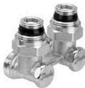
RLV-KS угловой с присоединением к отопительному прибору G ½ и G ¾