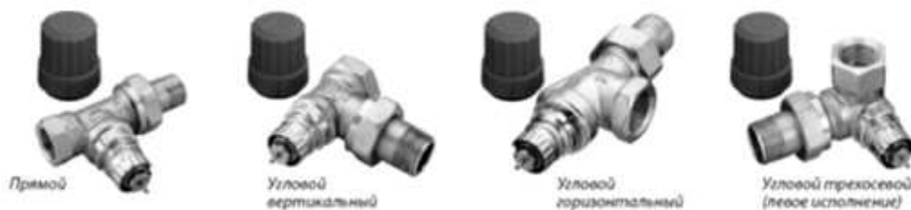
Рисунок - Клапаны терморегулирующие типа RTR-N

Клапаны терморегулирующие типа RTR-N предназначены для применения в двухтрубных насосных системах водяного отопления. Не предназначены для контакта с питьевой водой в системах хозяйственно-питьевого водоснабжения. Клапаны терморегулирующие типа RTR-N оснащены встроенным устройством для предварительной (монтажной) настройки его пропускной способности в рамках следующих диапазонов: